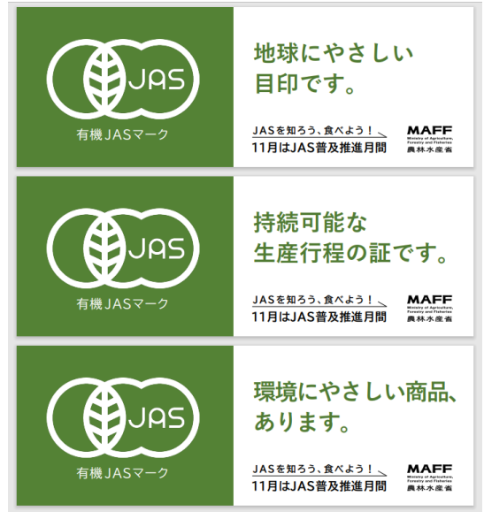
(2) JAS普及推進月間用のポスター、ポップへぜひご活用ください～