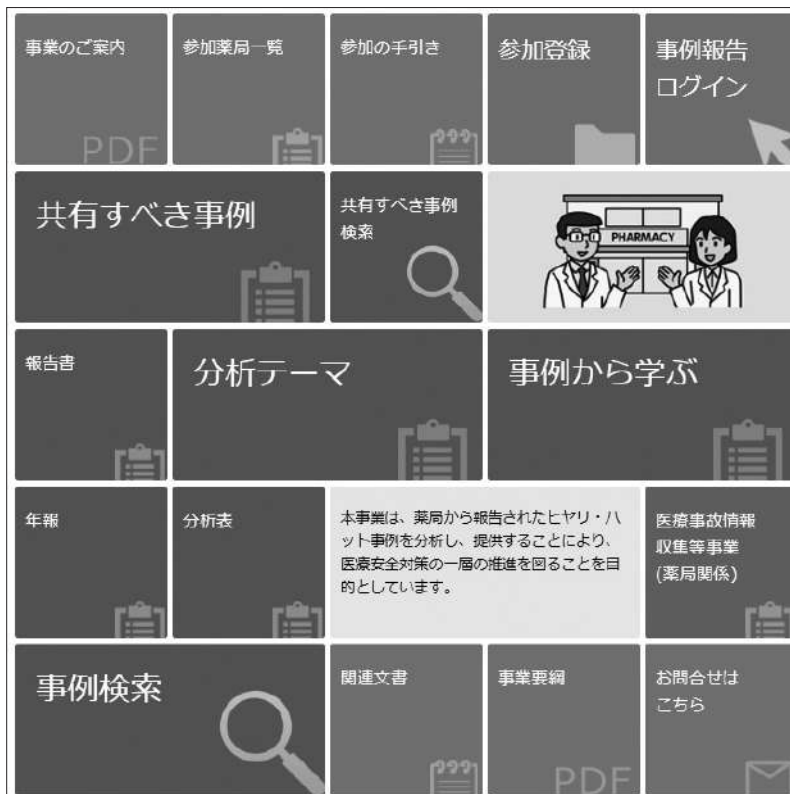
図表IV-1 ホームページのトップ画面

本事業では、事業計画に基づいて、報告書や年報、共有すべき事例、事例から学ぶなどの成果物や、匿名化した報告事例などを公表している。本事業の事業内容の掲載情報については、パンフレット「事業のご案内」に分かりやすくまとめられているので参考にさせていただきたい ( https://www.yakkyoku-hiyari.jcqh.or.jp/pdf/project_guidance.pdf )。